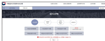
③ 묘지선택 후 신청