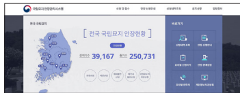
② 본인인증 후 안장신청 클릭