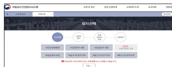
③ 묘지선택 후 신청