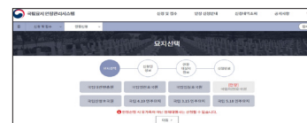
③ 묘지선택 후 신청