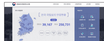
② 본인인증 후 안장신청 클릭