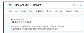
① 국립묘지 안장 신청시스템 검색